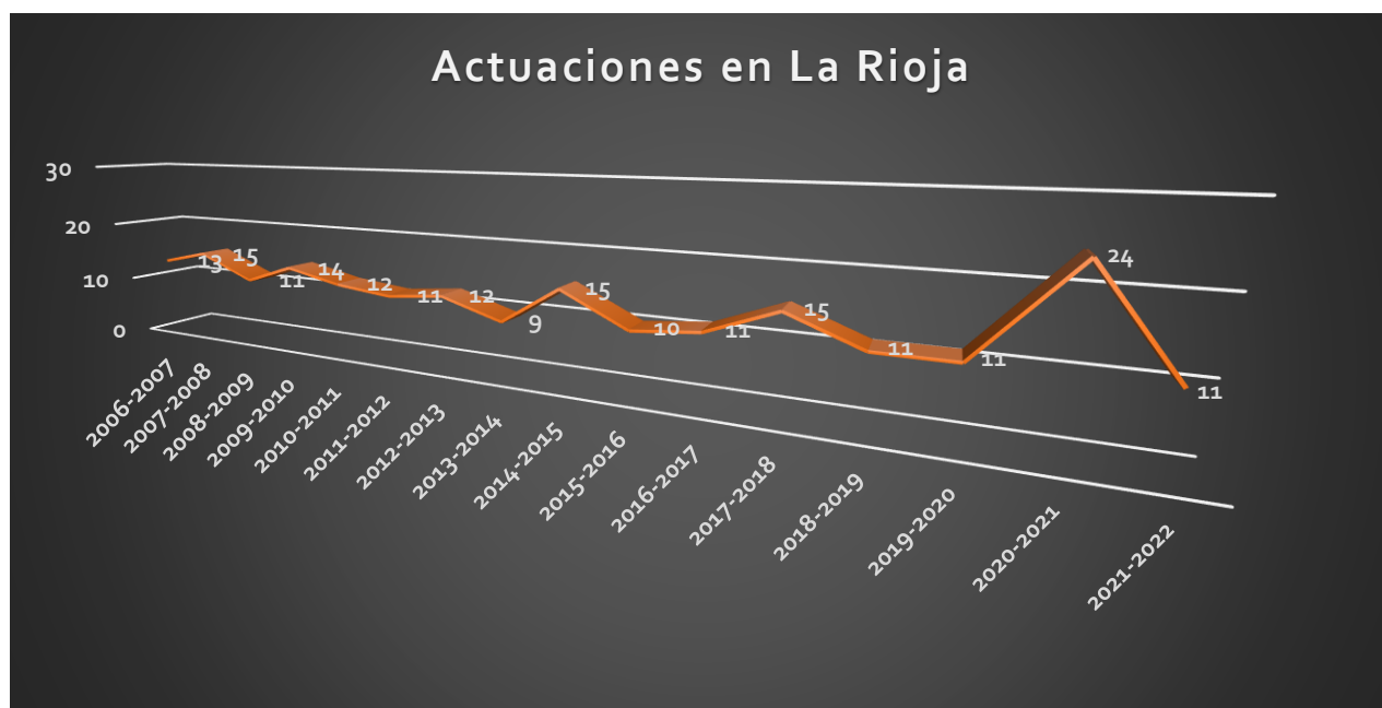
Figura 1: Evolución de las actuaciones del Defensor del Profesor en La Rioja

El Defensor del Profesor en La Rioja ha gestionado 205 casos en nuestra comunidad autónoma desde su implantación en el curso 2006/07 y atendió 11 casos en el último curso. Suponen un significativo descenso de casos respecto al curso anterior , que se armoniza con la media anual de 12,81 casos (Figura 1).