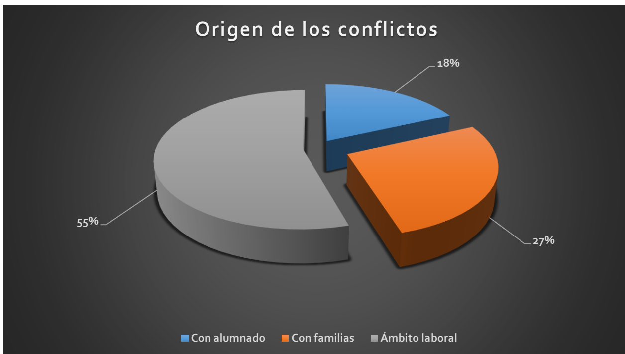
Figura 3: Tipos de conflictos en función de su origen

Es importante señalar que todos los casos señalados con anterioridad suponen situaciones de gran tensión para el profesorado, teniendo importantes repercusiones no solo en el desempeño de su labor sino en su salud física y psicológica . En todos los casos registrados, los afectados sufrieron un acusado grado de ansiedad , llegando a cursar baja laboral en un 18 % de los casos, lo que supone un coste añadido a la administración pública y que pone de manifiesto la ineficacia e insuficiencia del nuevo marco regulador de la convivencia y la ausencia de medidas para la protección de la salud mental del profesorado en los centros educativos de La Rioja.