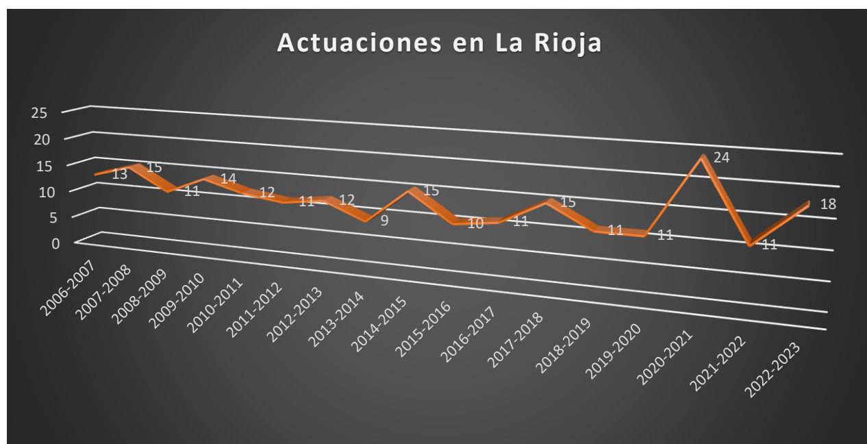
Figura 1: Evolución de las actuaciones del Defensor del Profesor en La Rioja

A nivel autonómico estos datos se traducen en un significativo aumento de casos respecto al curso anterior , cuyas causas son diversas: no solo hemos asistido a un deterioro de la convivencia en los centros educativos en el último año, sino que existe una mayor conciencia y sensibilidad del profesorado para denunciar situaciones que considera anómalas, un aumento de la indignación ante dichas situaciones, una mayor capacidad asertiva del profesorado para pedir ayuda y asesoramiento externo, y la mayor visibilidad que ha adquirido el servicio del Defensor del Profesor en estos últimos años.