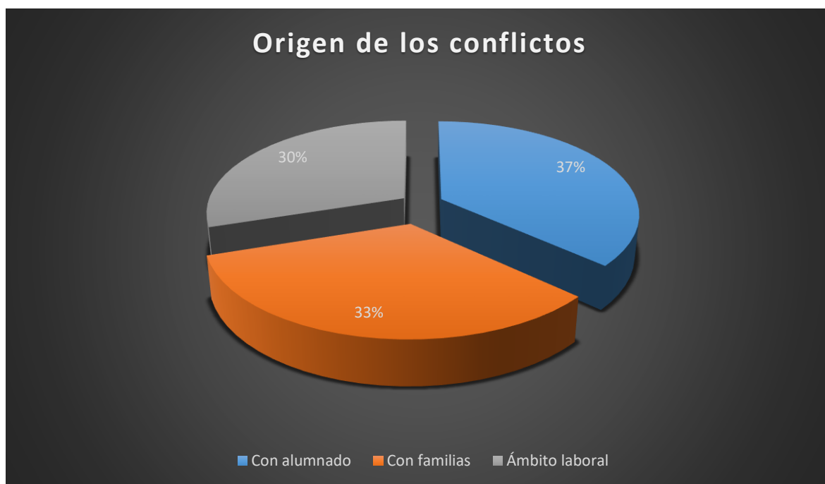
Figura 3: Tipos de conflictos en función de su origen

Es importante señalar que todos los casos señalados con anterioridad suponen situaciones de gran tensión para el profesorado, teniendo importantes repercusiones no solo en el desempeño de su labor sino en su salud física y psicológica . En todos los casos registrados, los afectados sufrieron un acusado grado de ansiedad (un 94 % de los casos atendidos) e incluso de depresión (un 11 % de los casos atendidos), llegando a cursar baja laboral en un 22 % de los casos atendidos, lo que supone un aumento de la cifra respecto a la del curso anterior. Es una cifra muy alta que