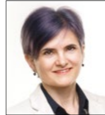
Por Clara Álvarez Servicio del Defensor del Profesor de ANPE-Rioja

Respecto al tipo de conflictos denunciados, con frecuencia los problemas afectan a varios ámbitos . De los 11 casos, sólo 4 tienen un único elemento de confrontación con el docente, mientras que en los otros 9 se ven implicados 2 y hasta, en un caso, 3 ámbitos. Las dificultades con los alumnos o al dar clase, donde los docentes demuestran tener habilidades para ello, tan sólo suponen un 17% de las áreas de conflicto y, en cambio, es en la relación con otros profesores, directivas o padres donde se generan los enfrentamientos , una tendencia que ya se constataba en cursos precedentes.