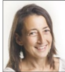
Por Teresa Asensio Secretaría de Formación de ANPE-Rioja

Por otro lado, están los cursos específicos de cada especialidad. La información con fechas, horarios y contenido la publicaremos antes de las vacaciones de Navidad. ¡Estad atentos a vuestros correos y a la página web!