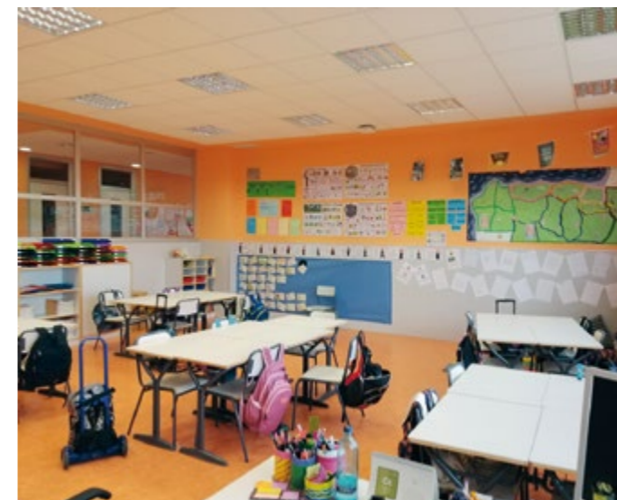
AULA DE CASTELLANO. CEIP VILLA PATRO

Áreas que imparte en inglés: en primero y segundo de Educación Primaria, se imparten en inglés las áreas de Ciencias Naturales, Ciencias Sociales, Artística (Plástica) e Inglés. En tercero y quinto de